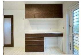
4号棟/カップボード