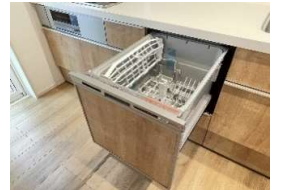
2号棟/食器洗浄乾燥機