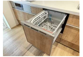
2号棟/食器洗浄乾燥機