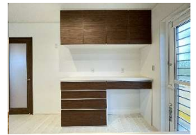
4号棟/カップボード